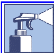
Tabela dozowania preparatu dezynfekcyjnego