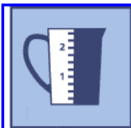
Tabela dozowania preparatu dezynfekcyjnego BOWI-SEPT art.nr 2760